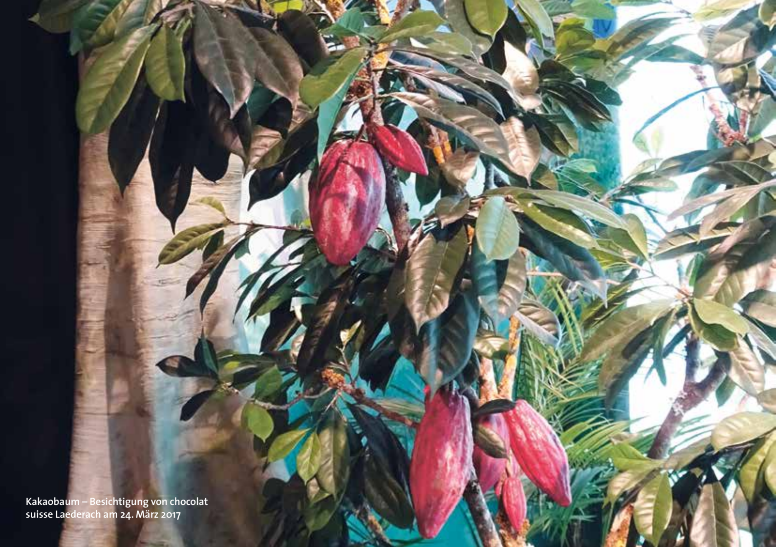
Kakaobaum – Besichtigung von chocolat suisse Laederach am 24. März 2017