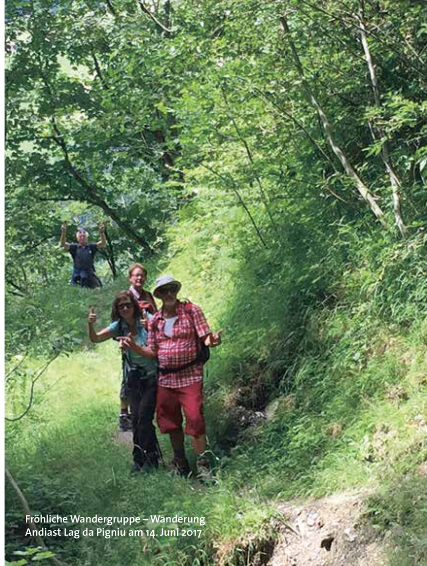
Fröhliche Wandergruppe – Wanderung Andiast Lag da Pigniu am 14. Juni 2017