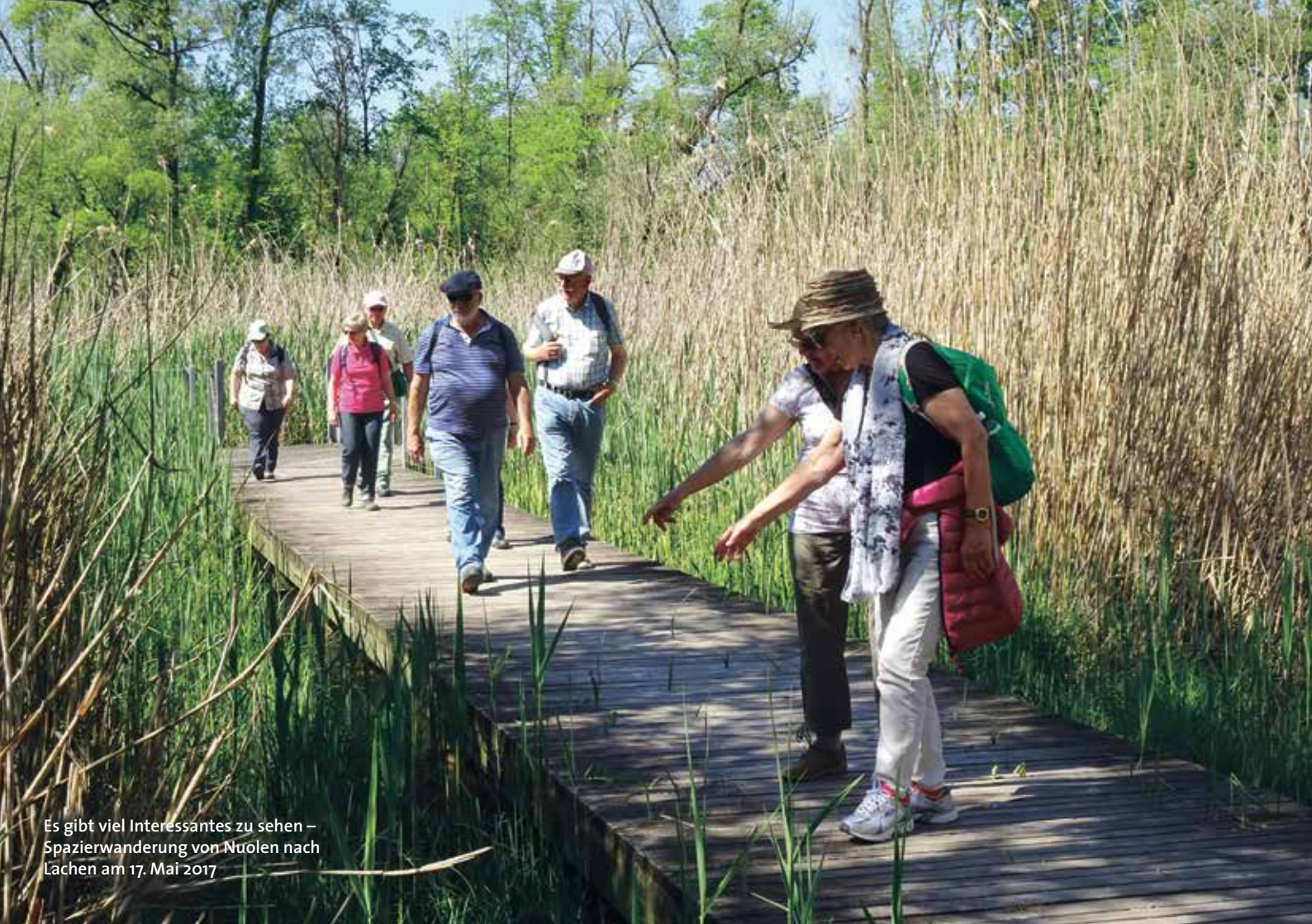
Es gibt viel Interessantes zu sehen – Spazierwanderung von Nuolen nach Lachen am 17. Mai 2017