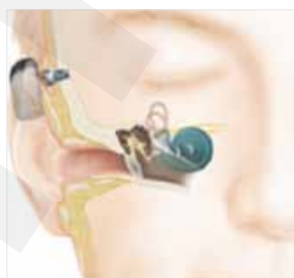
Abb. 2: Perkutanes knochenverankertes Hörsystem