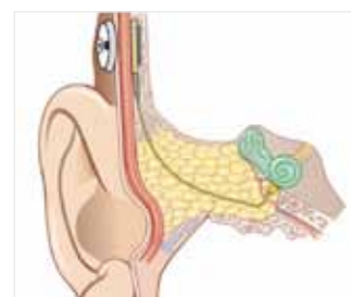
Abb. 4: Aktives Mittelohrimplantat ("Vibrant Soundbridge") mit Ankoppelung an die runde Fenstermembran