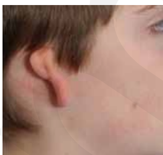
Abb. 1: Atresia auris congenita

Das weltweit erste Implantat wurde 1996 von Prof. Ugo Fisch in Zürich implantiert. In der Zwischenzeit wurden unterschiedliche Koppelungsmöglichkeiten erarbeitet und damit das Indikationsspektrum erheblich erweitert. Dadurch können z.B. auch Ohratresie-Patienten statt mit einem knochenleitenden System mit einem aktiven Mittelohrimplantat-System am mobilen Stapes rehabilitiert werden. Innovative Magnet-Designs ermöglichen nun auch die MRT-Tauglichkeit. Die Indikation zu diesen Systemen kann aufgrund der Komplexität nur an otologischen Implantat-Zentren erfolgen.